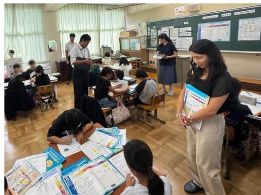
【伊吹小学校での授業の流れ】

令和8年度は、米原中学校区において同様の取組を実施する予定。併せて、総合教育センターにおける専門研修や学校安全の中核となる教員が集まる場において共有し、他校への普及を図る。