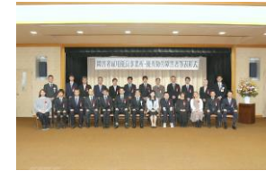
滋賀県優秀勤労障害者・ 障害者雇用優良事業所等表彰式