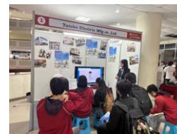
ハノイ工科大学における 合同企業説明会