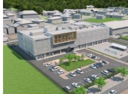
新施設完成イメージ図

令和8年7月の竣工を目指し、PFI手法(BT方式)で進めている東北部工業技術センター整備事業について、増額補正を行うもの。