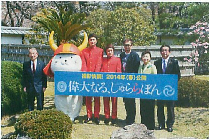
4月4日(木) 彦根城博物館でのクランクイン