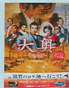
タイアップポスター