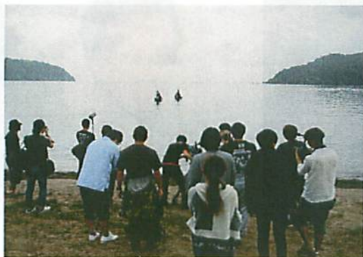
9月30日(日) 近江八幡市内