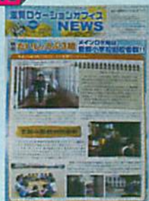
オフィスニュース