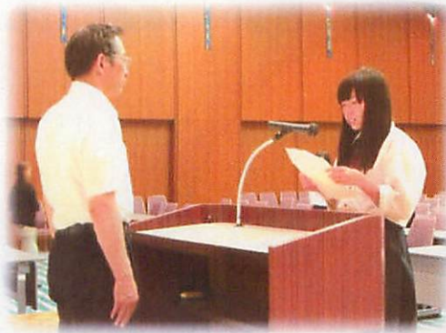
会長から委嘱状を交付される委員