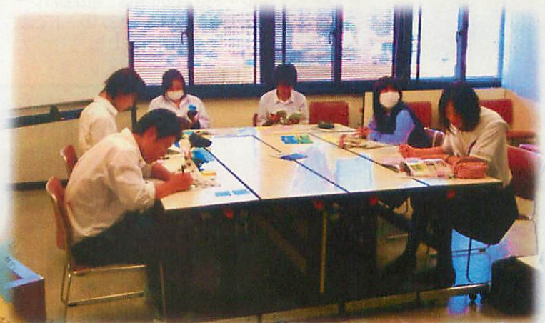
総務委員会でおもてなしのアイデアを考える委員