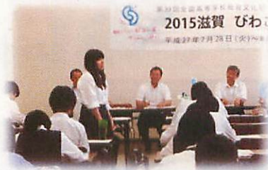
初めての集まり。自己紹介する委員