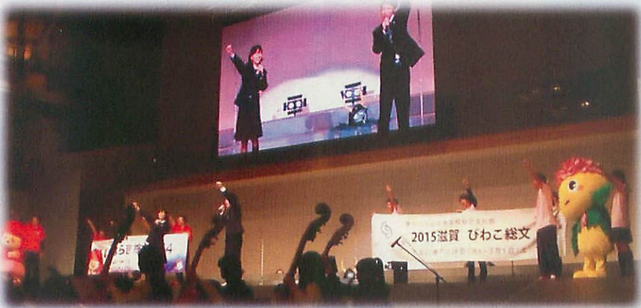
二県交流ステージ担当の6名は、朝からリハーサルや読み合わせを行い、総合開会式の第2部「交流」ステージに出演しました。ステージ後半には、滋賀県の大会マスコットキャラクターも登場し、びわこ総文をPRしました。パレード担当の6名も、観覧席から応援しました。