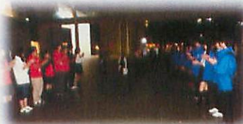
茨城県生徒実行委員と滋賀県生徒実行委員、対面式の様子

生徒業務別委員会の委員長、副委員長を中心とした12名の生徒実行委員が、10.12(土)に茨城県つくば市で開催された総合開会式とパレードに参加しました。10.11(金)の午後、滋賀を立ち、現地到着後、夜遅くまでリハーサルに臨みました。10.12(土)の午前中にパレード、午後には総合開会式、さらに、総合開会式の終了後には実行委員会の情報交換会に参加しました。10.13(日)は午前中に、部門のプレ大会を視察しました。