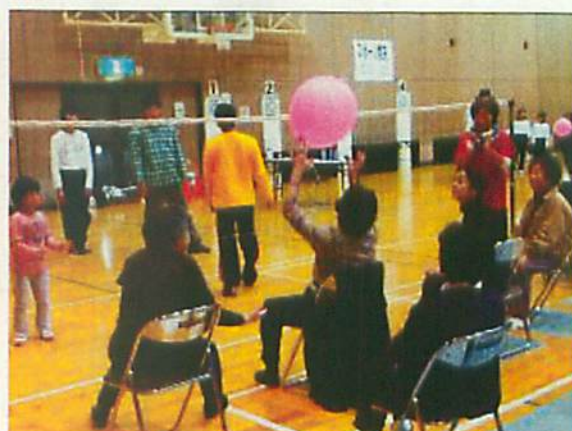
ふうせんバレーボール