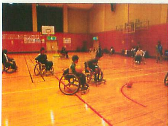
車椅子ツインバスケットボール