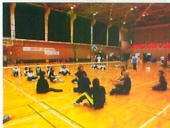
シッティングバレーボール