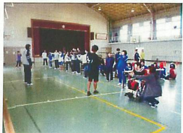
スポーツ吹矢講習会