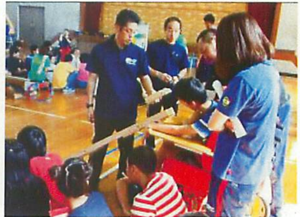
パラリンピック選手のボッチャ講習会