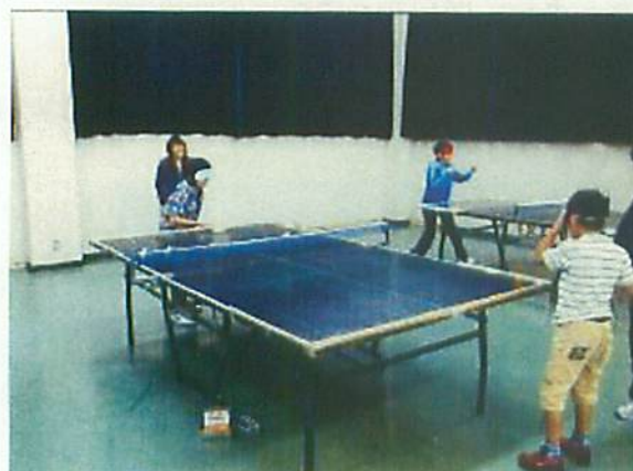
サウンドテーブルテニス