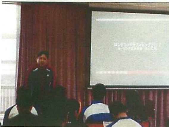
パラリンピック選手の講演