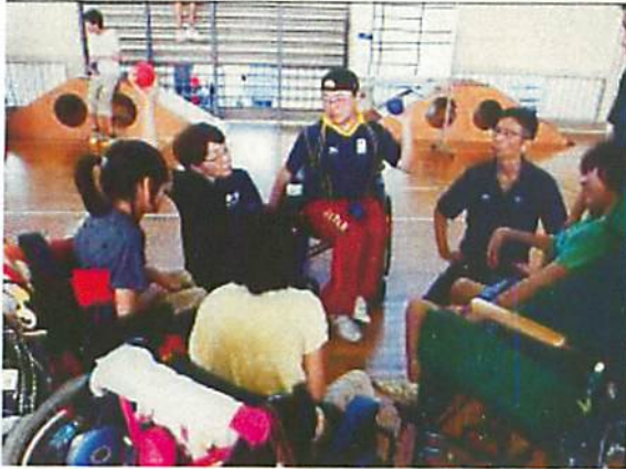
パラリンピック選手のボッチャ講習会