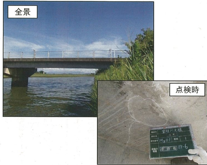
○家棟川大橋 ((一) 近江八幡大津線：野洲市安治)