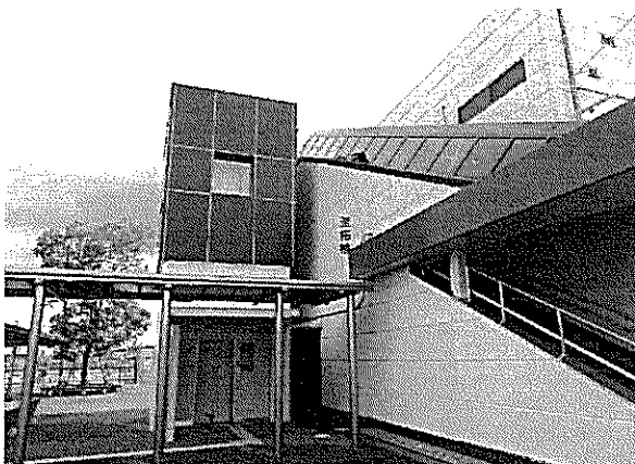
自由通路エレベーター(北口)