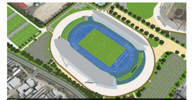
第1種陸上競技場の鳥瞰イメージ