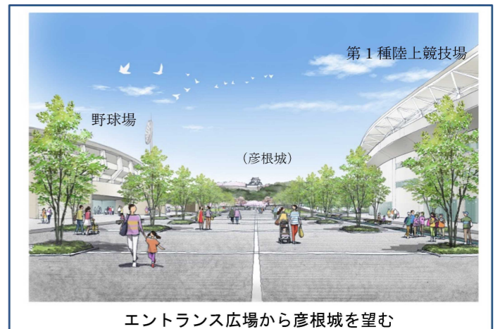
エントランス広場から彦根城を望む