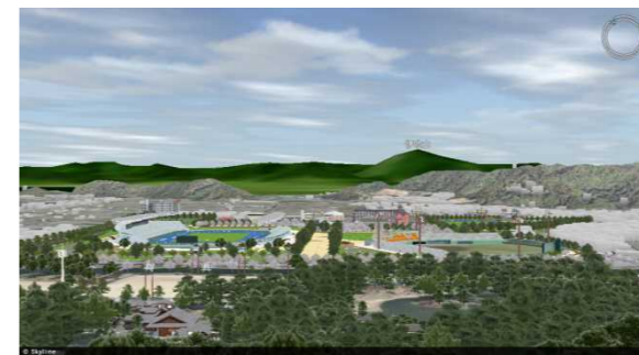
彦根城天守からの眺望イメージ