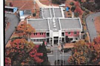
野外活動センター